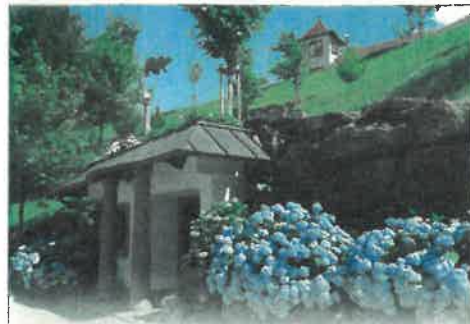
Schrägaufzug · Mittelstation im Herzen des Dollenbergparks

Der kürzeste Weg zu unserer Sankt Anna Kapelle und in den Dollenbergpark führt über unseren Schrägaufzug . Der Einstieg befindet sich bei der Tiefgarage. Den Zugang finden Sie gegenüber von Zimmer 103.